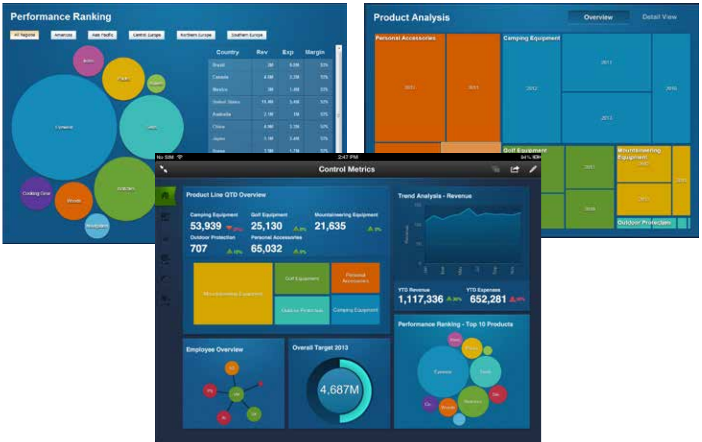
Figure 2: Une interface conviviale et intuitive offre un accès en libre-service complet pour les rapports et les analyses. Les utilisateurs peuvent recevoir des informations métier et interagir avec elles sur leur PC et dispositifs mobiles pour une mobilité et une souplesse accrues.